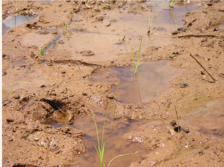
ಹೊಲದಲ್ಲಿ ಮಾರ್ಕರ್‌ನಲ್ಲಿ ಸಸಿಗಳು

ಸಸಿ ಮಡಿಯಿಂದ ಸಸಿ ತೆಗೆದ ತಕ್ಷಣ ಗದ್ದೆಯಲ್ಲಿ ನಾಟಿ ಮಾಡುವುದರಿಂದ ಅಧಿಕ ಬಲವಾದ ಬೇರು ಬಿಡಲು ನಂತರ ಸಸಿ ತನ್ನ ಪೂರ್ತಿ ಸಾಮರ್ಥ್ಯದೊಂದಿಗೆ ಇಳುವರಿ ನೀಡಲು ಸಹಾಯಕಾರಿಯಾಗುತ್ತದೆ.