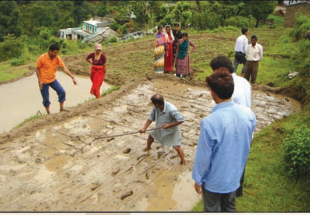
ಜಮೀನಿನಲ್ಲಿ ಮಾರ್ಕಿಂಗ್ ಮಾಡುತ್ತಿರುವುದು