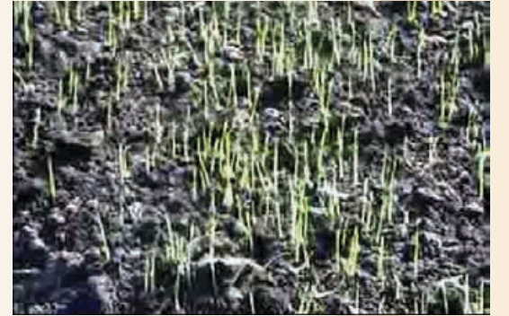
ಕವಲು ಒಡೆದ ಸಸಿಗಳು

ಮಳೆ ಬಿದ್ದಾಗ ನಾಟಿಮಾಡಲು ಸಸಿಗಳು ಸಿಗುವಂತೆ ಮಾಡುವುದು ಬಹಳ ಮುಖ್ಯವಾದ ಕೆಲಸ. ಕಡಿಮೆ ಬೀಜ, 8-15 ದಿನಗಳಲ್ಲಿ ಸಸಿ ನಾಟಿ ಮಾಡುವುದರಿಂದ, ಸಾಮೂಹಿಕ ಸಸಿ ಮಡಿ ಮಾಡುವುದು ಉತ್ತಮ. ಪ್ರತಿ 2-3 ದಿನದ ಅಂತರದಲ್ಲಿ ಸಸಿ ಮಡಿ ಮಾಡುವುದರಿಂದ ವಿವಿಧ ಸಮಯದಲ್ಲಿ ನಾಟಿಮಾಡುವುದಕ್ಕೆ ಸಸಿ ಸಿಗುವಂತಾಗುವುದು. ಇದರಿಂದ ಸ್ವಲ್ಪ ನೀರು ಹಾಳಗಬಹುದು ಆದರೆ ಸಕಾಲಕ್ಕೆ ನಾಟಿ ಮಾಡಲು ಸಹಕಾರಿಯಾಗಿರುತ್ತದೆ.