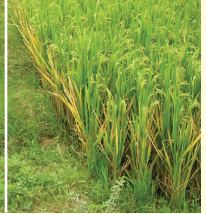
ಸಾಂಪ್ರದಾಯ ಭತ್ತದ ಬೆಳೆ