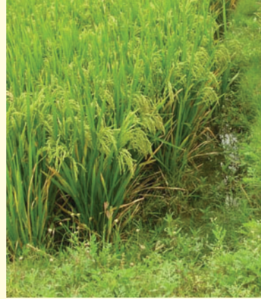
ಶ್ರೀ ಪದ್ಮತಿಯಲ್ಲಿ ಭತ್ತದ ಬೆಳೆ