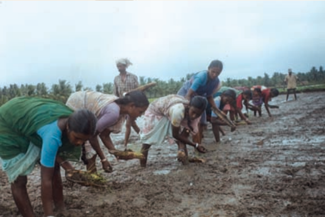
ಸಸಿ ಮಡಿಗಳನ್ನು ಎತ್ತಲು ಟ್ರೇಗಳನ್ನು ಬಳಸುತ್ತಿರುವುದು.

ಮಾಮೂಲಿ (ಸಾಂಪ್ರದಾಯಿಕ) ಪದ್ಧತಿಯಲ್ಲಿ ಭತ್ತದ ಸಸಿಯನ್ನು ಹಿಡಿದು ಕೀಳುತ್ತಾರೆ. ಇದನ್ನು ಸಸಿ ಕೀಳುವುದು ಎಂದು ಹೇಳುತ್ತಾರೆ. ಶ್ರೀ ಪದ್ಧತಿಯಲ್ಲಿ ಸಸಿ ಬಹಳ ಚಿಕ್ಕದಾಗಿ ಇರುತ್ತದೆ. ಆದ್ದರಿಂದ ಕಬ್ಬಿಣದಿಂದ ಮಾಡಿದ ದಪ್ಪವಾದ ರೇಕನ್ನು ಸಸಿಮಡಿಯ ಕೆಳ ಭಾಗಕ್ಕೆ (3-4 ಅಂಗುಲ ಕೆಳಗಿನಿಂದ) ಹಾಕಿ ಸಸಿಯನ್ನು ಮಣ್ಣಿನೊಂದಿಗೆ ಮೇಲೆಕ್ಕೆ ತೆಗೆಯಬೇಕು. ಅಂದರೆ ಕಬ್ಬಿಣದ ರೇಕಿನ ಮೇಲೆಕ್ಕೆ ಸಸಿ ಮತ್ತು ಮಣ್ಣು ಬರುತ್ತದೆ. ಇದನ್ನು ತಟ್ಟೆ / ಬುಟ್ಟಿ ಅಥವಾ ಕಬ್ಬಿಣದ ಹಲಗೆಗಳ ಮುಖಾಂತರ ನಾಟಿ ಮಾಡುವ ಗದ್ದೆಗೆ ತೆಗೆದುಕೊಂಡು ಹೋಗಬೇಕು. ಸಸಿಕಿತ್ತ ತಕ್ಷಣ ಸಾಧ್ಯವಾದಷ್ಟು ಬೇಗ (ಸಾಧ್ಯವಾದರೆ ಅರ್ಧಗಂಟಿಯೊಳಗೆ) ನಾಟಿಮಾಡಿದರೇ ಸಸಿ ಹಾನಿ ಆಗದಂತೆ ಇರುತ್ತದೆ.