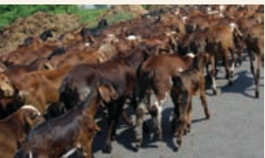
ಕುರಿಗಳ ಮಂದೆ ಇಡುವುದು

ಇದು ಸಾಂಪ್ರದಾಯಿಕವಾಗಿ ಅಳವಡಿಸುತ್ತಿರುವ ಪದ್ಧತಿ. ಹಸು, ಎಮ್ಮೆ, ಎತ್ತು, ಕುರಿ, ಮೇಕೆಗಳ ಹಿಂಡನ್ನು ಜಮೀನಿನಲ್ಲಿ ರಾತ್ರಿ ಹೊತ್ತು ಕಟ್ಟುತ್ತಾರೆ. ಅವುಗಳ ಗಂಜಲ/ಮೂತ್ರ, ಸಗಣೆಗಳಿಂದ ಜಮೀನಿನ ಸಾರ ಹೆಚ್ಚುತ್ತದೆ.