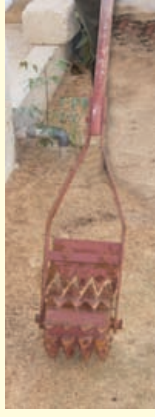
ಸಿಂಗಿಲ್ ಡ್ರಮ್ ವೀಡರ್