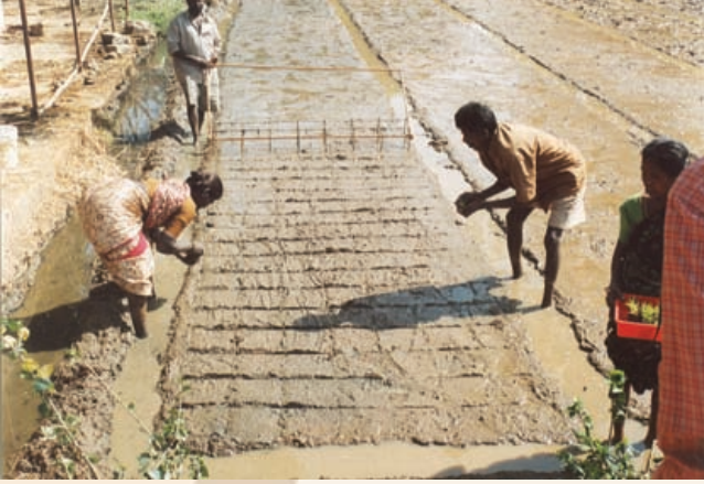
ಮಾರ್ಕಿಂಗ್ ಮಾಡಿರುವ ಸ್ಥಳಕ್ಕೆ ಸಸಿ ಮಡಿಯನ್ನು ವರ್ಗಾಯಿಸುತ್ತಿರುವುದು.