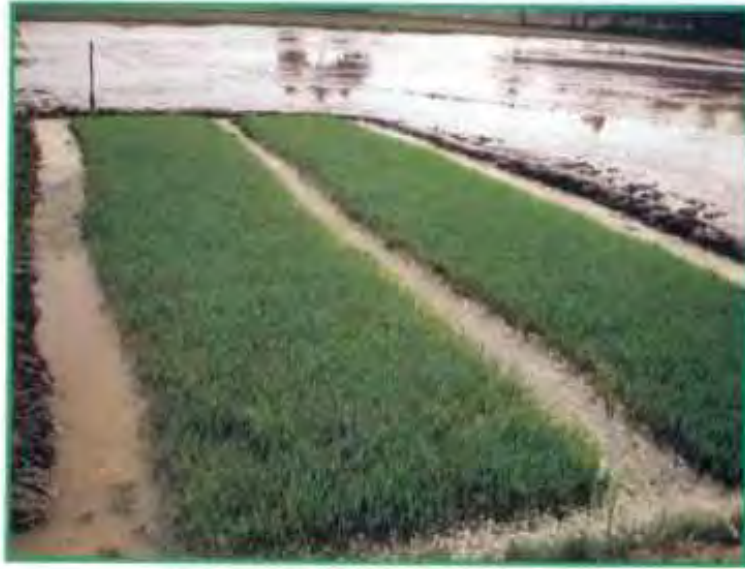
ஒரு ஏக்கருக்கு தேவைபான நாற்றங்கால்

இடைவெளியில் அமைக்கும்போது இடையே இருக்கும் மண்ணை வெட்டி எடுத்து மேடை அமைத்தாலே போதுமானதாகும்.