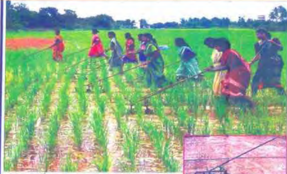
கனாமி பாதித்த நிலத்தில், கிராமணிகள் கிராம-கிராம தொகுப்பு திட்டமும் கனாமி பாதித்த நிலத்தை மீண்டும் பயன்படுத்தும் திட்டம் கிராமணிகள் மூலம் மேற்கொள்ளப்பட்டு வருகிறது.