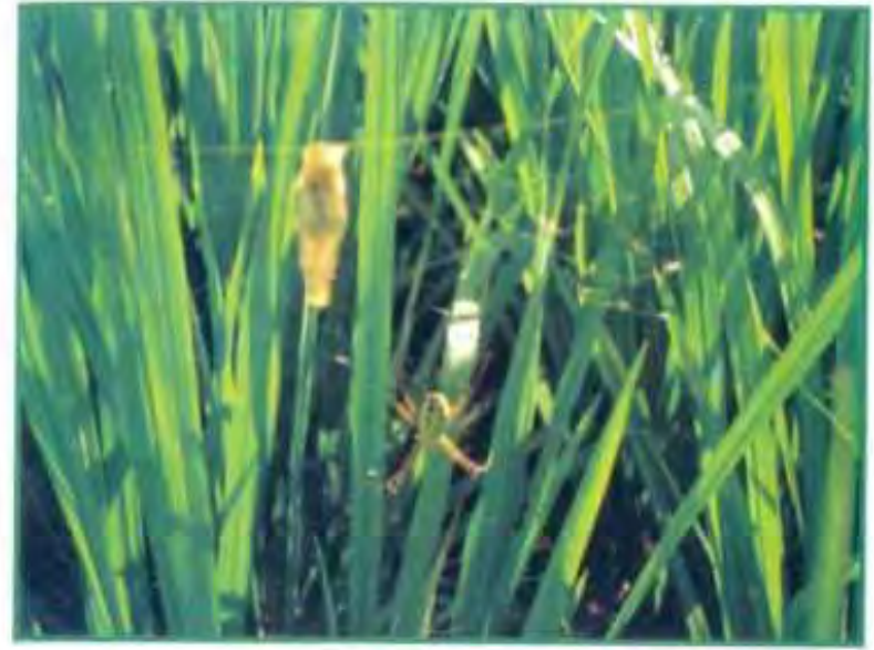
வெட்டுக்கிளி எதிர்பாடும் பூச்சி மற்றும் இரை தீமை செய்யும் பூச்சிகளை கட்டுப்படுத்தும் "வட்ட சிலந்தி"

மற்ற சில வழிமுறைகள் கீழே கொடுக்கப்பட்டுள்ளன.