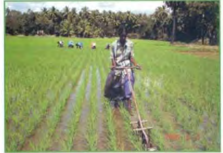
"கோனோவீடர்" களைக்கருவி மூலம் களை எடுத்தல்

நடவு செய்த 8 -10 ம் நாட்களுக்குள் சிறுசிறு களைகள் தோன்றும் போதே "கோனோவீடர்" எனும் களைக்கருவியைக் கொண்டு முதல் களை எடுத்தல் அவசியம். தொடர்ந்து, நடவு செய்த 18, 28 மற்றும் 38ம் நாட்களில் "கோனோவீடர்" களைக்கருவி மூலம் களை எடுக்க வேண்டும். வாரம் ஒரு முறை எடுத்தால் மிக அதிக மகசூல் எடுப்பது உறுதி.