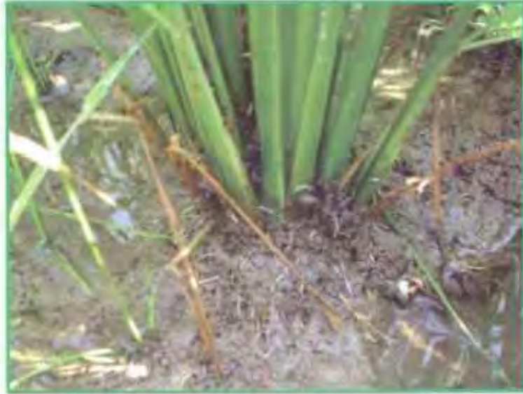
தண்ணீர் தேங்காததால் அதிக தூர்கள், வெள்ளை நீர் வேர்கள்

களைகளை கட்டுப்படுத்தும் ஒரே நோக்கோடு பல காலமாக நெற்பயிர் நீர் தேக்கிய நிலங்களில் பயிர் செய்யப்பட்டு வருகிறது. அதனால், இத்தகைய சூழலைத் தாங்கி வளரும் தன்மையை நெற்பயிர் பெற்றுள்ளது. எனினும் நீர் தேங்கிய வயலில் வேருக்குத் தேவைப்படும் பிராணவாயு தடைபடுகிறது. மேலும், நெற்பயிர் பூக்கும் நிலையை அடையும் பொழுது வேரின் முக்கால் பாகம் வளர்ச்சி இழந்து விடுகிறது மற்றும் பிராணவாயு கிடைப்பது தடைபட்டு பயிரின் செயல் மற்றும் வளர்ச்சி முழுவதுமாக குன்றிவிடுகிறது. தொடர்ந்து நீர் தேக்கி வைக்கப்படும் நெல் வயலில், தூர்களின் எண்ணிக்கை மிகவும் குறைந்து இருப்பதைக் காணலாம். ஆதலால், தற்போதைய நடவடிக்கையிலும் தண்ணீர் தேக்காமல் பயிர் செய்தால் அதிக தூர் கட்டுவதைக் காணலாம்.