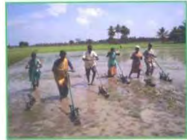
“கோனோவீடர்” களைக்கருவி பயன்படுத்த பயிற்சி

“கோனோவீடர்” (Cono weeder) எனும் களைக்கருவி கொண்டு நடவு செய்த 8 -10 ம் நாள் சிறுசிறு களைகள் தோன்றும் போதே பயிர்களுக்கு ஊடாக குறுக்கும் நெடுக்குமாக ஓட்டவேண்டும். அதன் பின்னர் நடவு செய்த 18, 28 மற்றும் 38ம் நாட்களில் “கோனோவீடர்” களைக்கருவியை ஓட்ட வேண்டும். கோனோ களைக்கருவியை பயன்படுத்துவதற்கு முதல் நாள் நிலத்திற்கு சீரான நீர் பாய்ச்சுவதன் மூலம் களைக்கருவியை பயன்படுத்த இலகுவாக இருக்கும். மேலும் அசோஸ்பைரில்லம், பாஸ்போபாக்டீரியா மற்றும் சூடோமோனஸ் ஆகியவற்றை 1 கிலோ வீதம் 50 கிலோ எருவுடன் (அ) மண்புழு உரத்துடன் கலந்து நிலத்தில் இட்டு அதன் பின்னர் களைக்கருவியை பயன்படுத்தினால் நுண்ணுயிர்கள் நன்கு மண்ணில் கலக்க ஏதுவாகும். ஒரு ஏக்கரில் களைக்கருவியை பயன்படுத்த 2 ஆண்கள் அல்லது 4 பெண்கள் தேவைப்படுவர்.