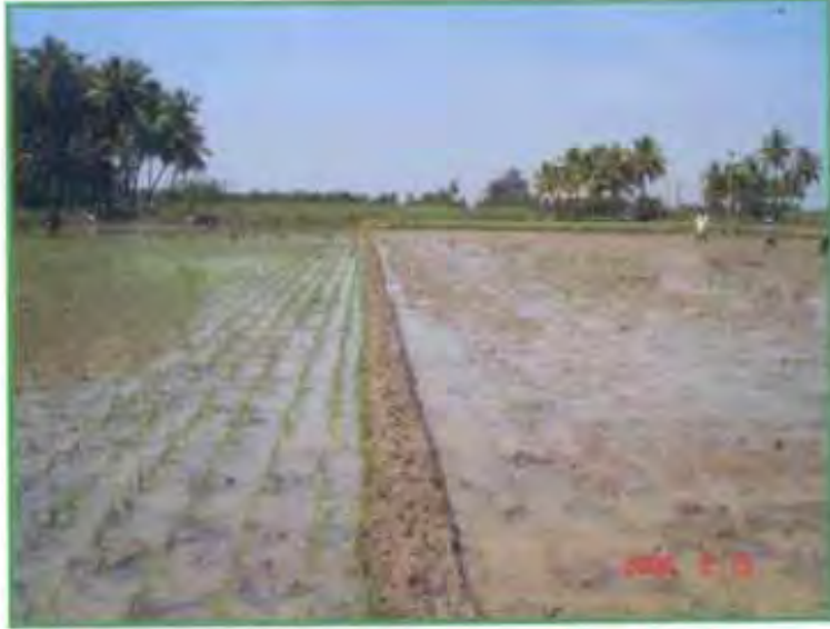
வயதான நாற்றங்கால் வரிசை நடவில்

அதிகமான பச்சை இலைப்பரப்பு இருப்பதால் பதர் இல்லாத நன்கு முற்றிய திரட்சியான மணிகள் உண்டாகின்றன. அதிக இடைவெளிவிட்டு சதுர நடவு செய்வதால் களைக்கருவி மூலம் இருபுறமும் களை எடுப்பது எளிதாகிறது.