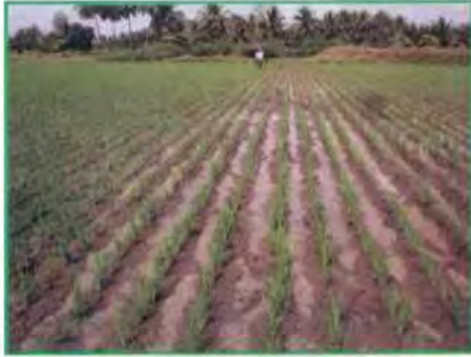
கோனோவீடர் களைக்கருவி பயன்படுத்திய பின்பு

“கோனோவீடர்” களைக்கருவி மூலம் களை எடுத்தால் களைகளை அகற்றுவதோடு மட்டுமல்லாமல் மண்ணைக் கிளறி விடுவதன் மூலம் பயிரின் வேர்களுக்கு அதிக காற்றோட்டம் கிடைப்பதால் பயிரானது வளமையோடும், அதிக தூர் வைக்கவும் வழி செய்கிறது. மேலும் மண்ணிலுள்ள நன்மை செய்யும் நுண்ணுயிர்கள் பெருகும். களைகள் அப்புறப்படுத்தப்படாமல் மண்ணிலேயே மக்க வைக்கப்படுவதால், களைகள் மக்கி இயற்கை உரமாக கிடைக்கின்றது.