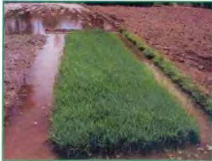
நாற்றங்கால் - 12ம் நாள் நாற்றுகள்

ஒரு ஏக்கருக்கு மூன்று கிலோ விதை போதுமானது. ஒற்றை நாற்றுகளாக நடவு செய்வதாலும், 25 செ.மீ க்கு 25 செ.மீ இடைவெளி விட்டு நடவு செய்வதாலும் ஒரு சதுர மீட்டரில் 16 பயிர்கள் இருக்கும். ஒரு ஏக்கர் என்பது 4,000 சதுர மீட்டர் ஆகும். ஆக ஒரு ஏக்கருக்கு 64,000 பயிர்கள்/விதைகள் தேவைப்படுகின்றன. சராசரியாக 1000 விதையின் எடை 25 கிராம் என்றால், 64,000 விதைகளின் எடை 1600 கிராம் அதாவது 1.6 கிலோ ஆகும். விதை முளைப்புத் திறன் மற்றும் இதர இயற்கை பாதிப்பு ஆகியவற்றைக் கணக்கில் கொண்டு சராசரியாக ஏக்கருக்கு 3 கிலோ விதை போதுமானதாகும். சாதாரண நடவு முறையில் தற்பொழுது விவசாயிகள் ஏக்கருக்கு 50 கிலோ வரை பயன்படுத்துகின்றனர்.