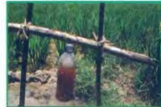
செயலூக்கம் செய்யப்பட்ட இ.எம். பாசனம் மூலமாக

தாய் திரவமான 1 லிட்டர் "இ.எம்.1" ஐ, 25 லிட்டர் "செயலூக்கம் செய்யப்பட்ட இ.எம்" ஆக முதலில் மாற்ற வேண்டும். முழுமையாக கரைக்கப்பட்ட ஒரு கிலோ வெல்லத்தை 23 லிட்டர் சுத்தமான (குளோரின் இல்லாத) தண்ணீரில் கலக்கவும். பின்னர் அதில் ஒரு லிட்டர் "இ.எம்.1" திரவத்தைக் கலக்கவும். இக்கலவையை பிளாஸ்டிக் வாளியில் ஊற்றி காற்றுப் புகாதவாறு மூடிவைக்கவும். தினமும் ஒரு முறை ஒரு விநாடி மூடியைத் திறந்து வாளியில் உருவாகியுள்ள வாயுவை வெளியேற்றவும். ஒரு வாரத்தில் "செயலூக்கம் செய்யப்பட்ட இ.எம்" தயார். இதனை நிழலான இடத்தில் சேமித்து வைத்து ஒரு மாத காலத்திற்குள் பயன்படுத்த வேண்டும்.