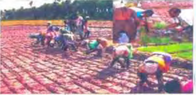
புதுச்சேரி, தருமபுரி, கனாமி பாதித்த நிலத்தில், கிராமணிகள் கிராம-கிராம தொகுப்பு திட்டமும் கனாமி பாதித்த நிலத்தை மீண்டும் பயன்படுத்தும் திட்டம் கிராமணிகள் மூலம் மேற்கொள்ளப்பட்டு வருகிறது.