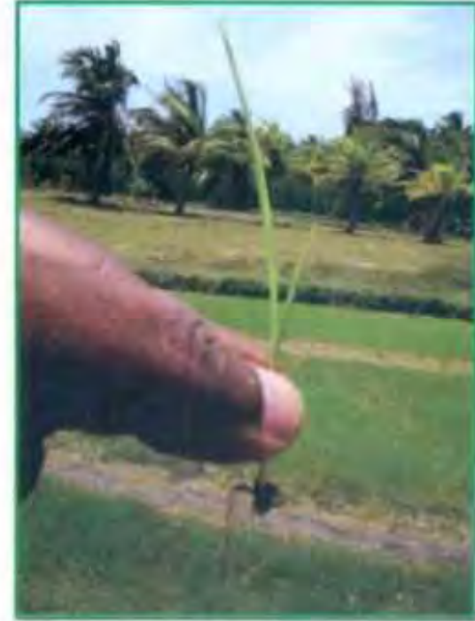
தூரண்டு தூலை, விதைப்பையுடன் - 10ம் நாள் நாற்று

8 முதல் 12 வயது நாற்றுகளை நடவேண்டும். தற்பொழுது பின்பற்றப்படும் 30 முதல் 45 நாள் வயதான நாற்றுகளை நடுவதால், நாற்றுகள் தூர் கட்டும் பருவத்தை நாற்றங்காலிலேயே பெரும் பகுதியை செலவழிக்கின்றன. மேலும் வயதான நாற்றுகளை பிடுங்கி நடும்போது வேர்கள் அதிகளவு அறுபட்டு மீண்டும் வேர்கள் பிடிக்க 1 வாரம் பிடிக்கும். ஆனால் இள வயது நாற்றுகளை விதைப்பையோடு கவனமாக நடுவதால் இந்த பிரச்சனைகள் ஏற்படாது.