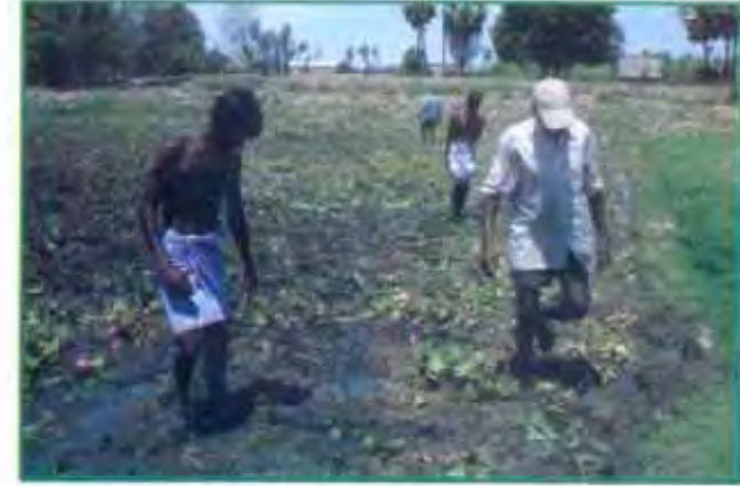
தலை மற்றும் இயற்கை ஒரு மண் வளம் காக்கும்

நிலத்தில் அதிக அளவு இயற்கை ஒரு இட்டு பயிர் செய்யும் போது அதிக மகசூல் கிடைப்பது உறுதி செய்யப்பட்டுள்ளது. வளமான மண்ணை வளமான பயிரை உருவாக்க முடியும் என்பதை நாம் மனதில் கொள்ள வேண்டும். வளமான பயிரானது பூச்சி மற்றும் நோய் எதிர்ப்பு சக்தியுடன் வளரும். தேவைக்கேற்ப இயற்கை வழி பூச்சி நோய் கட்டுப்பாட்டு முறையை கையாள வேண்டும். குறைந்தளவு உரங்கள் பயன்படுத்தியும் ஒற்றை நாற்று நடவு முறையில் பயிர் செய்யலாம்.