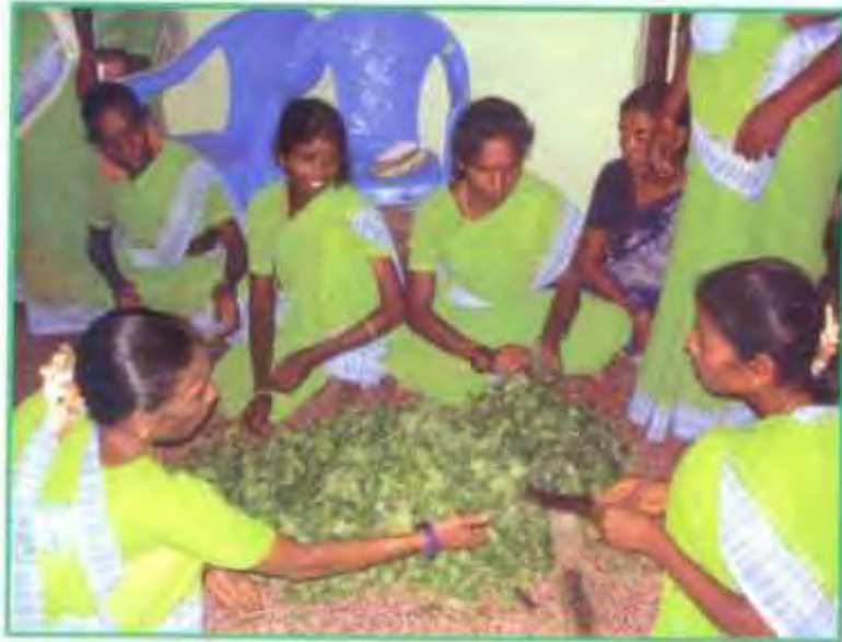
இ.எம். நொதித்த தழைச்சாறு தயாரிப்பில் கலந்துகொள்ளும் பெண்கள்

மூலிகை குணமுள்ள தழைகளை 2 – 3 கிலோ அளவு சிறு துண்டுகளாக நறுக்கி 15 லிட்டர் தண்ணீரில் மூழ்கும் அளவு செய்யவும். அதனுடன் சிறிதளவு பூண்டு, மிளகு, புகையிலை, இஞ்சி, போன்றவைகளை அரைத்து சேர்க்கவும். பிறகு அதில் 1 லிட்டர் "செயலூக்கம் செய்யப்பட்ட இ.எம்" ஐ கலந்து மூடி வைக்கவும். "செயலூக்கம் செய்யப்பட்ட இ.எம்" தயார் செய்ய பின்பற்றிய நடைமுறையை பின்பற்றவும். ஒரு வார காலத்திற்குப் பிறகு சுத்தமான துணி கொண்டு வடிகட்டி சேமித்து வைத்துக் கொள்ளவும். "இ.எம் நொதித்த தழைச்சாறு" இரண்டு மாதம் வரை வைத்திருக்கலாம். ஒரு லிட்டர் "இ.எம் நொதித்த தழைச்சாறு" 100 லிட்டர் நீருடன் கலந்து பூச்சி தாக்குதல் தென்படும் போது தெளிக்கவும்.