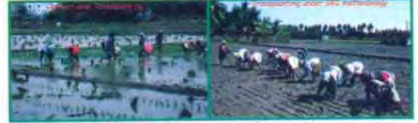
வழக்கில் உள்ள நடவு முறை

அழுத்திவிட்டு நாற்றை அதில் வேர்கள் பக்கவாட்டில் வருவது போல் வைக்க வேண்டும். அப்படி வைத்தால் செடி மற்றும் வேரின் அமைப்பு 'L' போன்று தோன்றும். முதன்முதலாக நடுவதற்கு சிறிது சிரமமாக இருந்தாலும் தொடர்ந்து பயிற்சி பெற்றால் மிகவும் எளிதாக இருக்கும்.