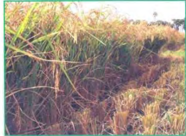
அதிக மழையிலும் சாயாத, அதிக விளைச்சலுடன்