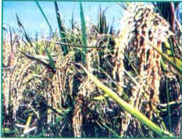
பதர்கள் இல்லாத முற்றிய கதிர்கள்

ஒற்றை நாற்று நடவு முறையை முறையாக பின்பற்றி பயிர் செய்தால் அதிகளவு தூர்கட்டுவதோடல்லாமல் (சராசரியாக 50 முதல் 65 வரை) அனைத்து தூர்களிலும் கதிர் சீராக உருவாகும். ஒவ்வொரு கதிரிலும் நெல் மணியின் எண்ணிக்கையும் எடையும் அதிகரிக்கும். மேலும் அதிக மழை, காற்றிலும் வெள்ளைப் பொன்னி போன்ற பயிர் சாயாமல் நிற்கும். வைக்கோல் அதிக அளவில் கிடைக்கும். மகசூல் 25 முதல் 50 சதம் வரை கூடுதலாக கிடைக்கிறது. சில இடங்களில் மகசூல் இரட்டிப்பாகவும் கிடைக்கிறது. ஒற்றை நாற்று நடவு முறையில் சராசரியாக ஏக்கருக்கு 5 டன் வரை மகசூல் எடுத்துள்ளனர்.