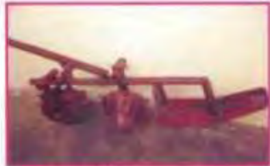
இதன் விலை ரூ. 750 மட்டுமே

கோனோவீடர் களைக்கருவி தமிழ்நாடு வேளாண் பல்கலைக்கழகத்தால் வடிவமைக்கப்பட்டது.