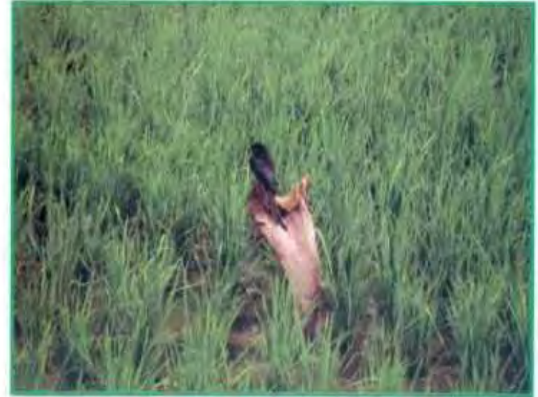
இயற்கை வழி பூச்சிக் கட்டுப்பாட்டில் பறவைகள்

ஒருங்கிணைந்த பயிர் பாதுகாப்பு முறையினை பின்பற்ற வேண்டும். இயற்கைவழி பூச்சிக்கட்டுப்பாட்டு முறைகளை மட்டுமே பயன்படுத்துவது நல்லது. வரப்புகளில் உளுந்து, பச்சைப்பயறு போன்ற பயறு வகை பயிர்கள் விதைப்பதன் மூலம் நன்மை செய்யும் பூச்சிகள் இனப்பெருக்கம் செய்ய உகந்த சூழ்நிலை உருவாகும். நடவு செய்த 20ம் நாள் ஏக்கருக்கு 25 "T" வடிவ குச்சிகள் அல்லது தென்னை மரத்தின் அடிமட்டையை நட வேண்டும். இதனால் பறவைகள் (குறிப்பாக கருவாட்டுவால் குருவி) வந்து குச்சிகளில் அமர்ந்து புழு மற்றும் வெட்டுக்கிளி போன்ற பூச்சிகளை பிடித்து உண்ணும். இரவு நேரங்களில் கோட்டான் வந்தமர்ந்து எலிகளை பிடித்து உண்ணும்.