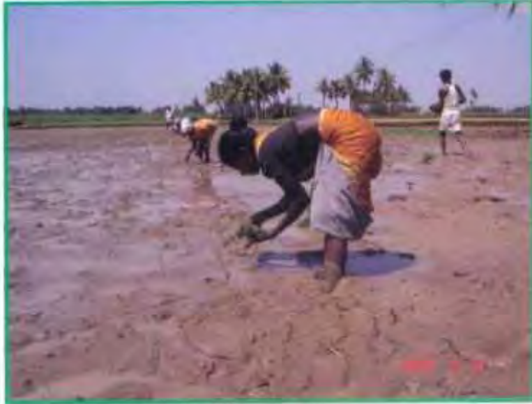
பயிற் பிடித்து 25 செ.மீ X 25 செ.மீ நடவு

வரிசைக்கு வரிசை 25 செ.மீ மற்றும் செடிக்கு செடி 25 செ.மீ இடைவெளி விட்டு, ஒற்றை நாற்றுகளாக சதுரமாக நட வேண்டும். ஒற்றை நாற்றுகளாக அதிக இடைவெளி விட்டு நடுவதால், காற்றோட்டம் மற்றும் சூரிய ஒளி பயிர்களுக்கு நன்கு கிடைக்கும். இதனால் பயிர்களின் வேர் பிடிக்கும் தன்மை மற்றும் தூர் கட்டும் திறன் அதிகரிக்கும் மேலும், மண்ணிலிருந்து கிடைக்கும் சத்துக்களை பயிர்கள் போட்டியின்றி பெற முடியும்.