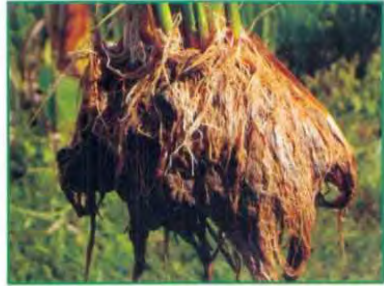
ஒற்றை நாற்று நடவுமுறையில் ஒரு பயிரின் வேர் வளர்ச்சி

25 செ.மீ இடைவெளி விட்டு நடும் போது ஒரு வார இடைவெளியில் 4 முறை களைக்கருவியைப் பயன்படுத்த முடியும்.