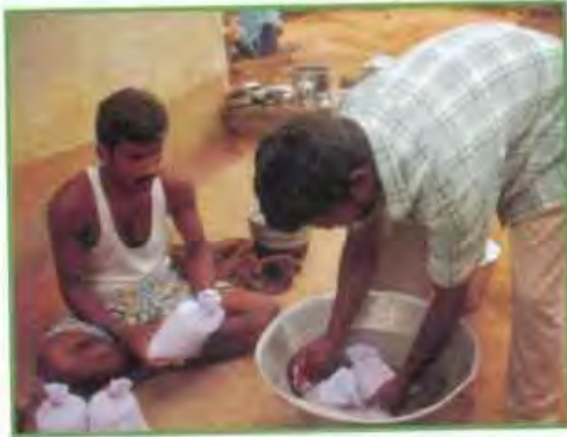
விதைகளை கோமியக் கரைசலில் ஊற வைத்தல்

ஒற்றை நாற்று நடவு முறை மூலம் பயிர் செய்வதற்கு அனைத்து நெல் ரகங்களும் ஏற்றவையே. அந்தந்தப் பருவத்திற்கு ஏற்ற ரகங்களைத் தேர்வு செய்ய வேண்டும். தரமான விதைகளைத் தேர்ந்தெடுக்க உப்பு நீர் கரைசலில் விதைகளை கொட்டவும். தண்ணீரை விட உப்பு நீருக்கு அடர்த்தி அதிகமாக இருப்பதால் பதர்கள், திடமற்ற விதைகள் போன்றவை மேலே மிதக்கும். அவைகளை நீக்கிவிட்டு நல்ல விதைகளை எடுத்து சுத்தமான நீரில் 2 அல்லது 3 முறை அலசவும். திடமான விதைகளை 24 மணி நேரம் தண்ணீரில் ஊற வைத்து அதன் பின்னர் 24 மணி நேரம் இருட்டான பகுதியில் வைத்தால் நன்கு முளை கட்டும்.