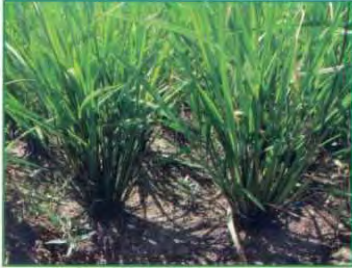
காய்ச்சலும் பாய்ச்சலும் நீர் பாசனம்

நடவு செய்ததிலிருந்து தண்டு உருளும் பருவம் வரை பாசனமானது காய்ச்சலும், பாய்ச்சலும் முறையை பின்பற்றி செய்ய வேண்டும். இப்பருவத்தில் 1 அல்லது 2 செ.மீ அளவு நீர் கட்டி, நிலத்தில் சிறு கீரல்கள்/வெடிப்பு ஏற்பட்ட பின்னர் மீண்டும் நீர் கட்ட வேண்டும். தண்டு உருளும் பருவத்திலிருந்து அறுவடைக்கு 15 நாட்கள் முன் வரை 1 அல்லது 2 செ.மீ அளவு நீர் கட்டி பின்னர் நிலத்தின் மேற்பரப்பில் நீர் மறைந்தபின் நிலத்தைக் காயவிடாமல் நீர் கட்ட வேண்டும்.